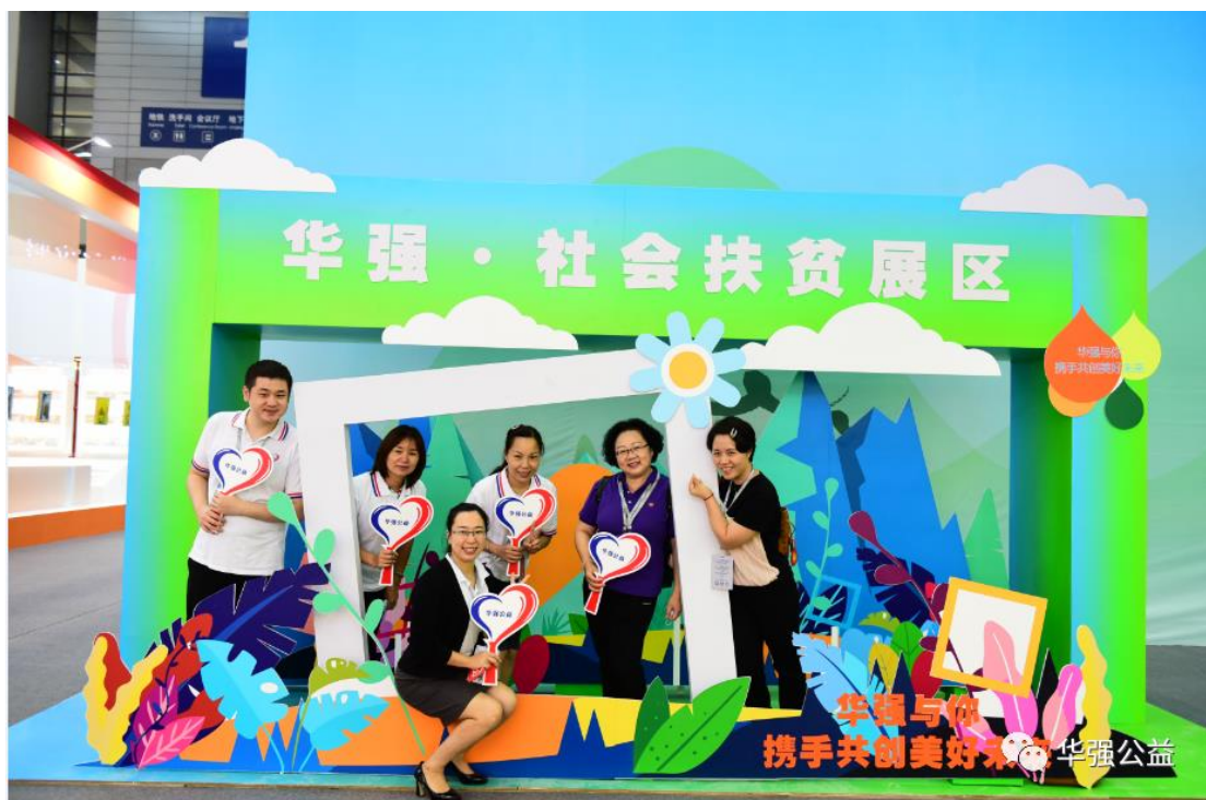
“华强·社会扶贫展区”网红打卡点

据初步统计，本届慈展会吸引来自全国 31 个省、自治区、直辖市以及港澳台地区的 1966 家机构和项目以及 1969 种消费扶贫产品参展，现场参观、参会公众近 11 万人次，线上浏览和参与直播带货、媒体直播等在线互动人次逾 4045 万。